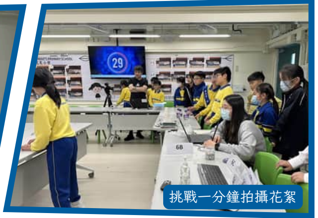
挑戰一分鐘拍攝花絮