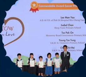
"SOW in Love" Letter Writing Competition 4B Yeung Tze Tung