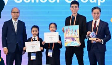
「雲遊通義 - 阿里雲香港 10週年校際生成式AI比賽」 小學組比賽中榮獲冠軍