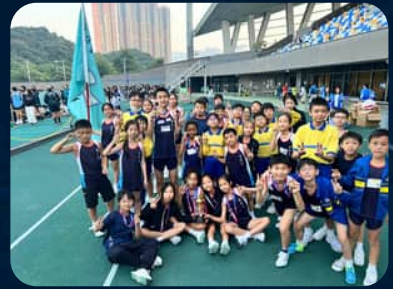
九龍西區小學校際田徑賽