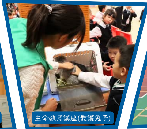
生命教育講座(愛護兔子)