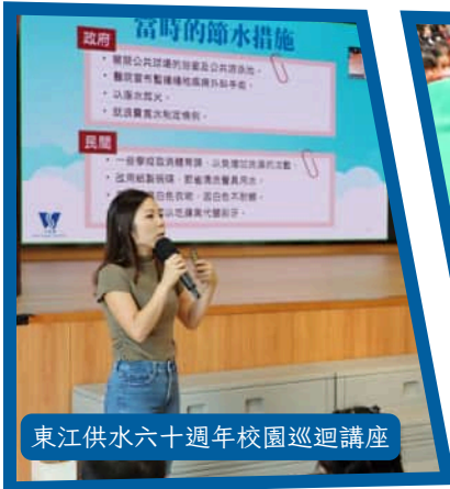
東江供水六十週年校園巡迴講座