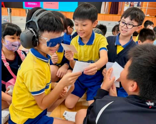
同學模擬長時間在視力模糊的狀態下看東西的情況