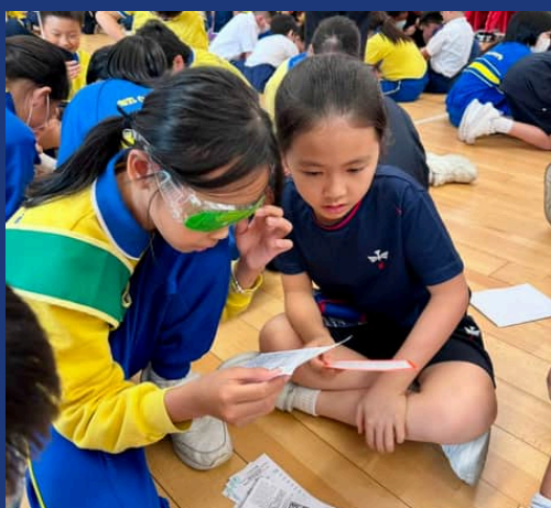
大家專心致志地進行任務

本年度訓練小五、小六學生成為「好哥哥好姐姐」，透過3A (A – Active 主動關心、A – Accompany 陪伴傾訴、A – Ask for help 尋找幫助) 教導小五、六學生照顧小一生，以協助小一生適應校園生活，從中實踐「非以役人，乃役於人」的精神，共建關愛和諧校園。