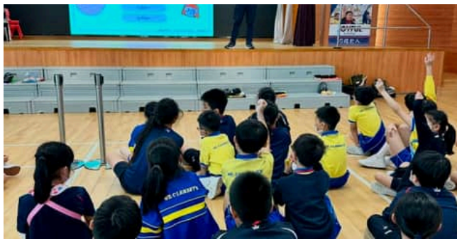
同學反應熱烈，積極回答講者提問