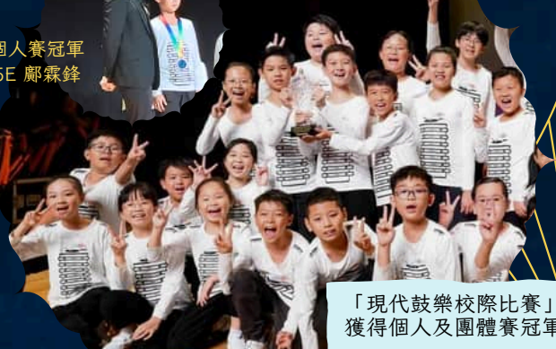
「現代鼓樂校際比賽」 獲得個人及團體賽冠軍