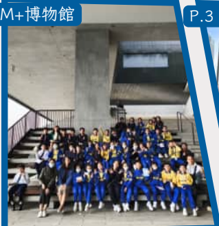
P.3 坐開篷巴士遊西九