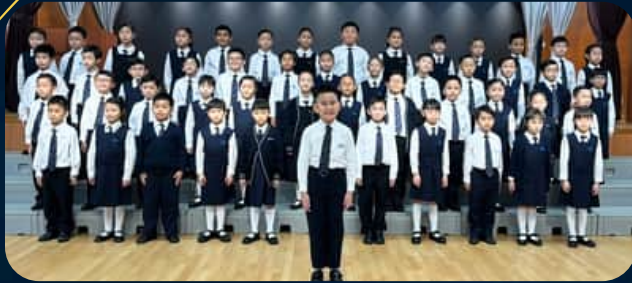
英詩集誦隊獲得第76屆香港學校朗誦節集誦冠軍