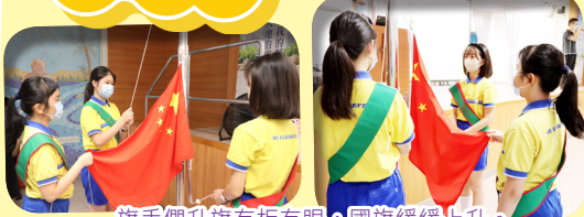
旗手們升旗有板有眼，國旗緩緩上升。