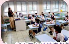
小一新生專心地聽老師講解課堂規矩及注意事項。