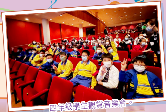
四年級學生觀賞音樂會。

本校六年級學生於11月9日前往香港文化中心音樂廳參與「超越時空的樂器」管風琴導賞活動。而四年級學生則於12月5日前往沙田大會堂演奏廳觀賞「音樂競技場」管樂音樂會。活動中，講者教授豐富的音樂知識和進行示範，學生獲益良多。