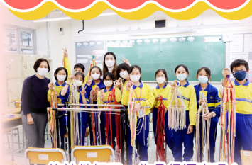
終於做好了，作品很漂亮呢！