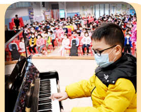
同學展現才藝，琴棋書畫，樣樣皆精！