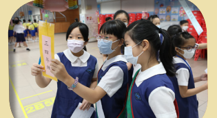
同學投入活動，踴躍猜燈謎。