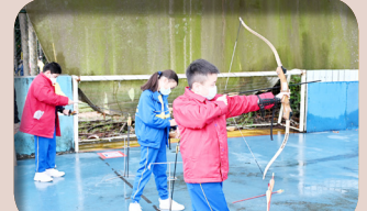
同學們認真地學習射箭。