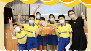
同學們拿着燈籠與黃主任一起留下倩影。