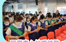
同學專心地唱詩歌，期待新學年的開始。