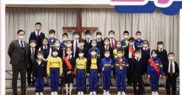
三年級成績優異學生