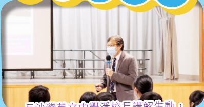
長沙灣英文中學潘校長講解生動，學生和家長都聚精會神地聆聽。