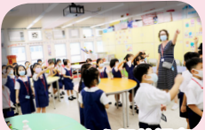
同學第一次參觀英語室，顯得十分興奮。