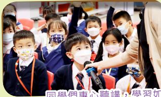
同學們專心聽講，學習如何做一個負責任的主人。