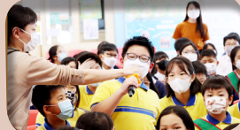
同學積極回答問題。