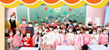
一年級同學與老師聖誕大合照。