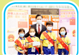
國慶日問答活動三年級 最踴躍參與班別 3C