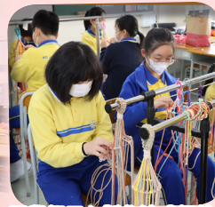
同學們用心製作法式繩結。