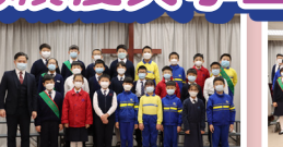
四年級成績優異學生