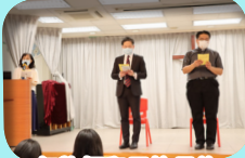
何牧師和馬校長為我們主持開學禮。