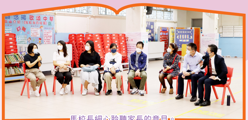
馬校長細心聆聽家長的意見。