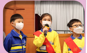
女同學表現淡定，認真比賽。