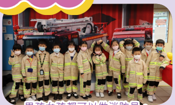
男孩女孩都可以做消防員。