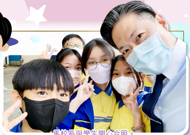
馬校長與學生開心合照。