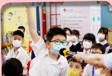
同學很厲害，答中問題了，恭喜你啊！