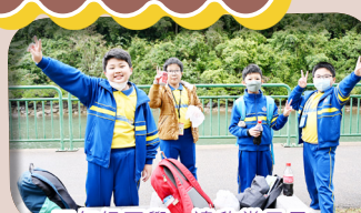
四年級同學一邊欣賞風景，一邊享受美食。