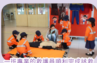
一班專業的救護員順利完成拯救傷者的任務。