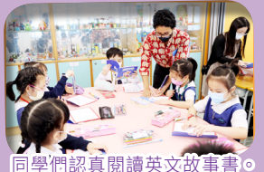
同學們認真閱讀英文故事書。