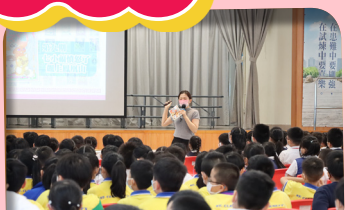
三、四年級的同學表現投入，專心聆聽作家的分享。