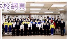
六年級成績優異學生