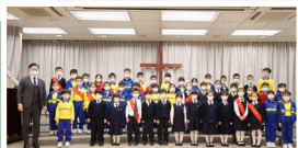
一年級成績優異學生