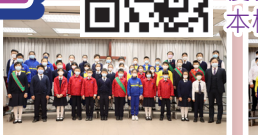
五年級成績優異學生