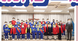
三年級成績優異學生